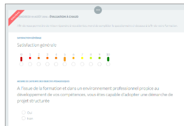
Evaluation à chaud