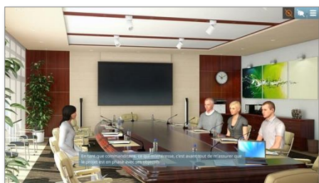
Exemple de Serious Game