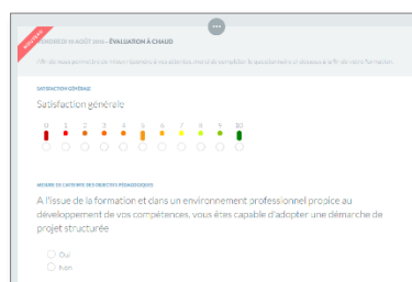
Evaluation à chaud