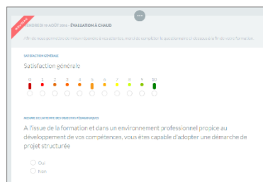
Evaluation à chaud