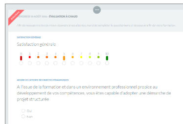
Evaluation à chaud