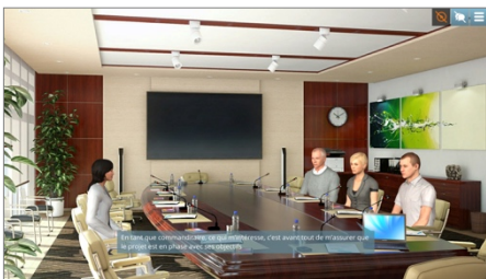
Exemple de Serious Game