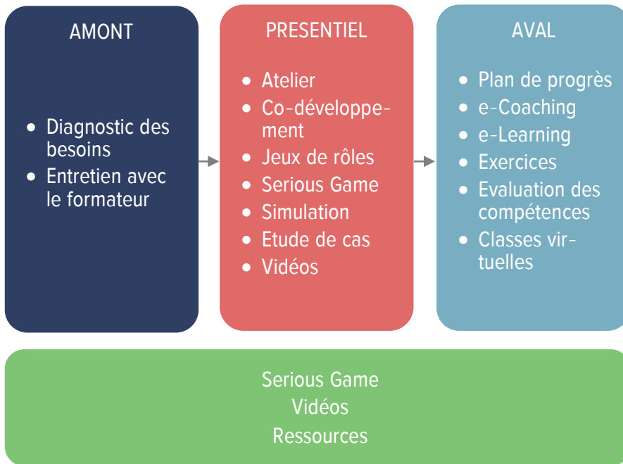
Figure 1 - Dispositif de formation blended learning

La figure ci-dessous illustre et synthétise l'ensemble du dispositif :