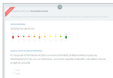
Évaluation à chaud