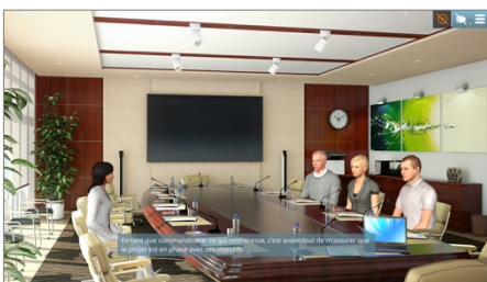
Exemple de Serious Game